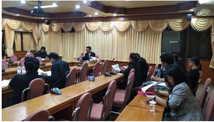
ประชุมเผยแพร่และประชาสัมพันธ์ช่องทางการตอบแบบวัดการรับรู้ EIT ให้ผู้มีส่วนได้ส่วนเสียภายนอกกรับทราบ